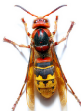
Frelon commun (jusqu'à 4 cm)