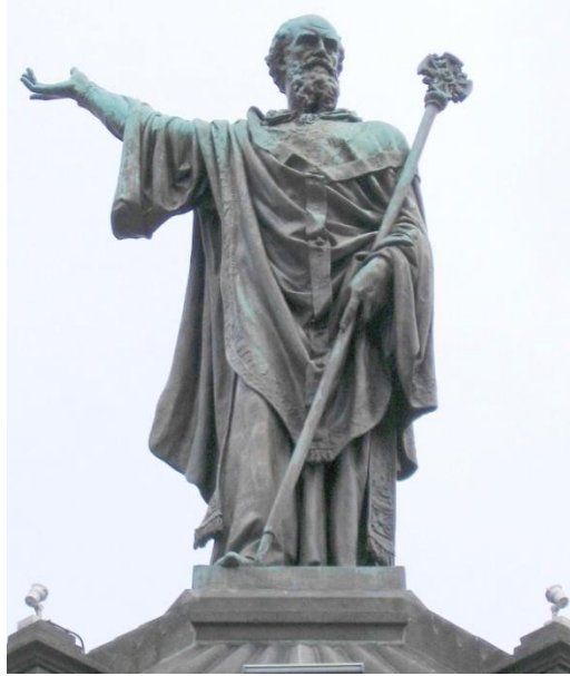
Le pape urbain II (statue à Clermont-Ferrand)