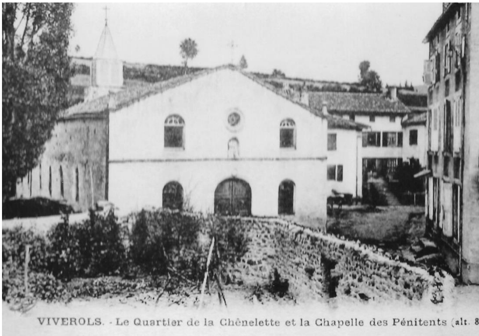
VIVEROLS. - Le Quartier de la Chênelette et la Chapelle des Pénitents (alt. 8)